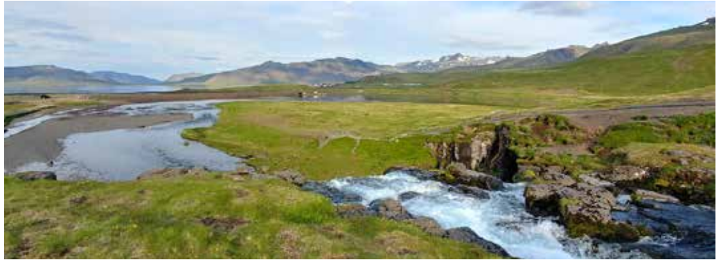
myndinni er tekin frá Kirkjufellsfossi og á henni sést til miðbiks sveitarinnar þar sem bókasafnið varð til.

Þegar nemendum fjölgaði í barnaskólahúsinu var bóka-kosturinn um tíma í nýju Safnaðarheimili Grundarfjarðarkirkju en annars í geymslu þar til tekin var ákvörðun um að koma því myndarlega fyrir í miðrými nýrrar viðbyggingar skólahússins árið 1978 með fulltingi skólafólks og bókasafnsnefndar. Það varð öllum mikið áfall að árið 1979 brann