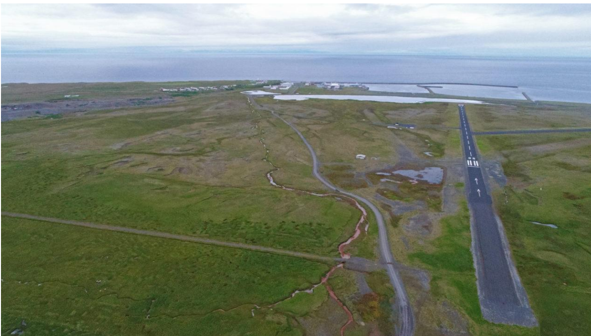
Mynd sunnan Rifs