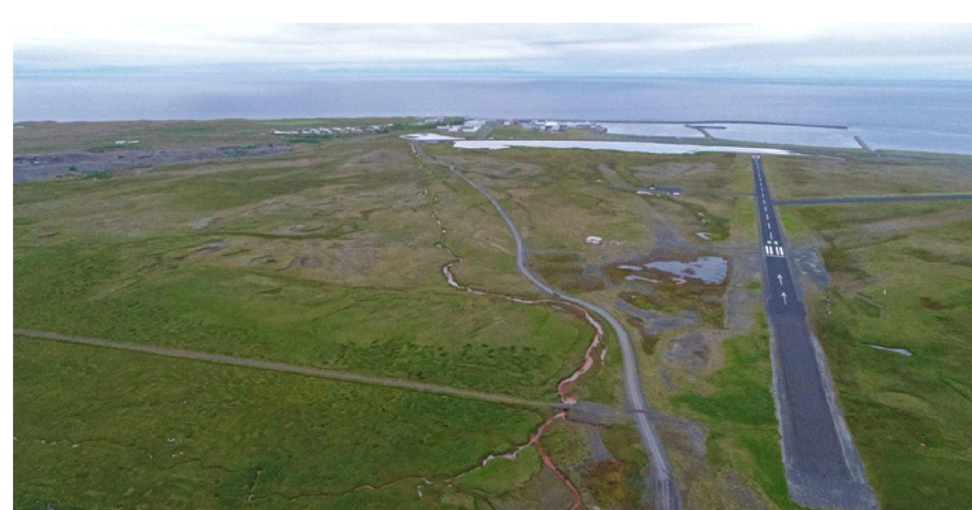
Mynd sunnan Rífs: Edwin Roald

Málsmeðferð: Eftir að bæjaryfirvöld samþykka tillögu þessa verði hún kynnt íbúum sveitarfélagsins og öðrum hagsmunaaðilum með áberandi hætti. Tillögu verður breytt eftir þörfum. Eftir samþykki bæjarstjórnar Snæfellsbæjar, verður leitað heimildar Skipulagsstofnunar til að auglýsa tillögu í samræmi við 31. grein skipulagslaga. Þá tekur við 6 vikna auglýsingarferli og að því loknu mun bæjarstjórn fjalla um tillöguna á nýjan leik og taka afstöðu til fram kominna athugasemda. Eftir að bæjarstjórn hefur samþykkt tillögu, skal hún send Skipulagsstofnun ásamt fram komnum athugasemdum og umsögnum um þær innan 12 vikna frá því að athugasemdafrestur rennur út, í samræmi við 32. grein skipulagslaga. Eftir það lætur Skipulagsstofnun auglýsa gildistöku í B deild Stjórnartíðinda innan fjögurra vikna. Aðalskipulagsbreyting tekur gildi þegar hún hefur verið samþykkt af bæjarstjórn, hlotið staðfestingu Skipulagsstofnunar og verið birt í b-deild Stjórnartíðinda.