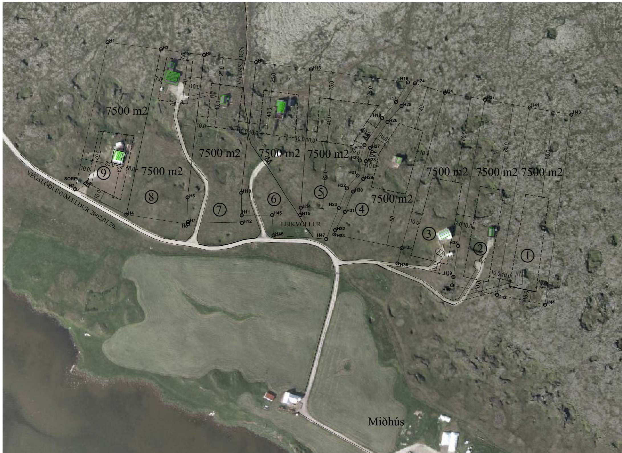
Deiliskipulag, Mkv. 1:2000