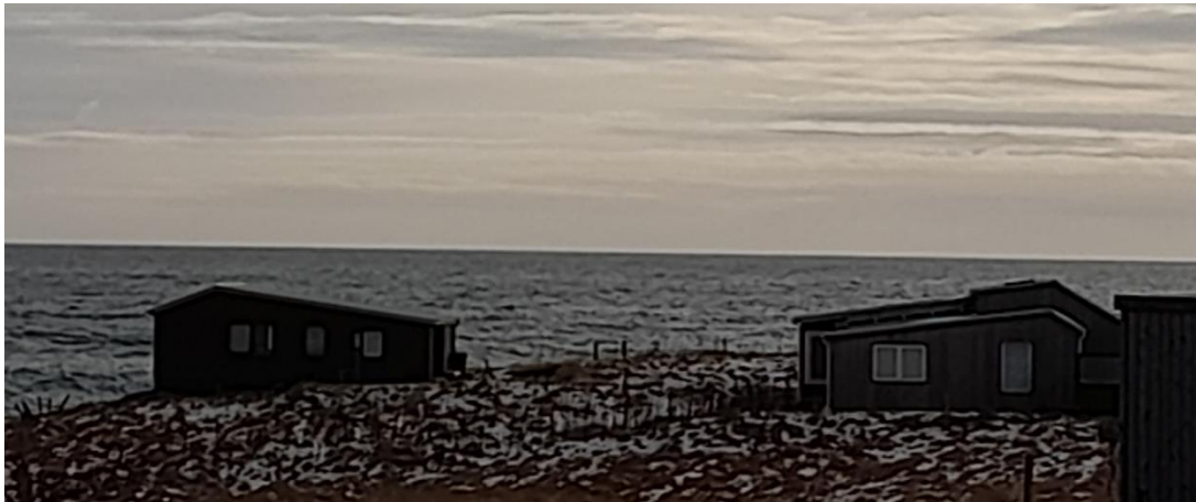
Bakki og Bakkabúð