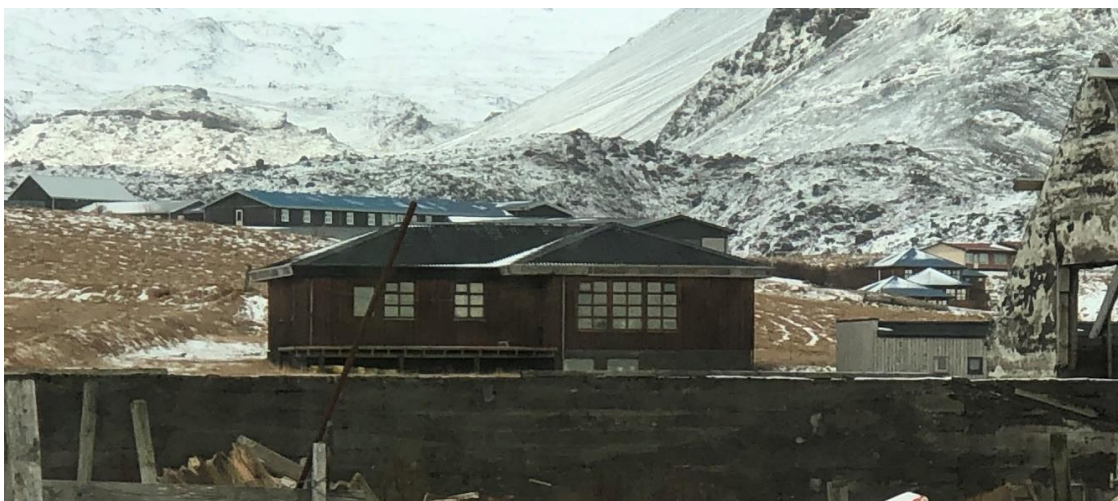
Íbúðarhús og tvö gestahús að Ökrum 2