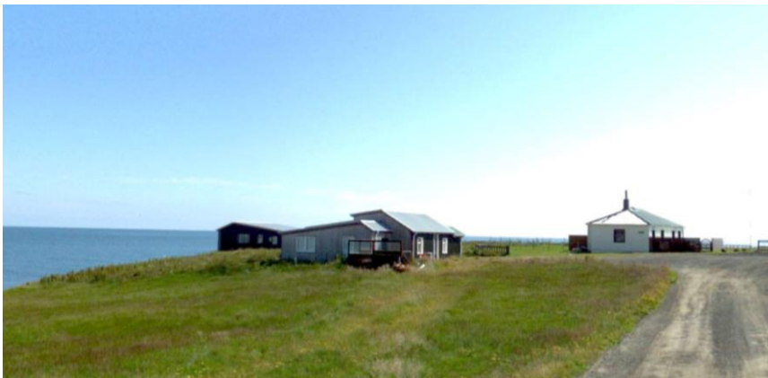
Bakki, Bakkabúð og Bárðarbúð

Húsin Bakkabúð og Bakki eru stílhreinir fulltrúar byggingarforma síns tíma. Þau ásamt Bárðarbúð mynda fallega þyrpingu sem er einkennandi fyrir staðinn og hefur verndargildi sem heild.