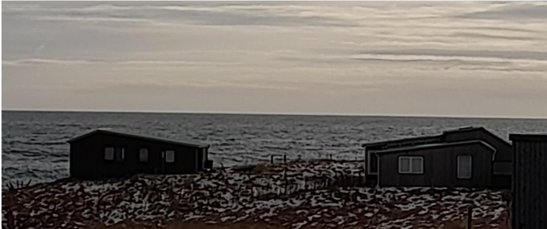
Bakki og Bakkabúð