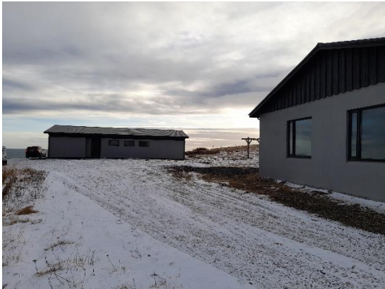
Íbúðarhús og vélaskemma

Byggingarefni íbúðarhúss og véla- og verkfærageymslu er steypa (óskráð). Teikningar af húsum eru til á snb.is.