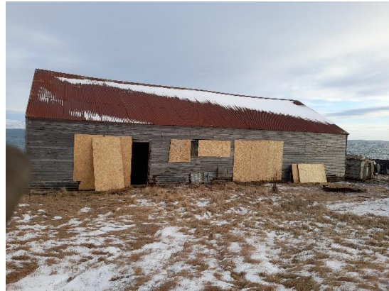
Fiskverkunarhús neðan vegar