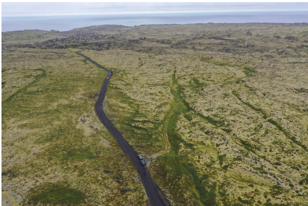
Mynd 3 Dritvíkurvegur, horft til vesturs.