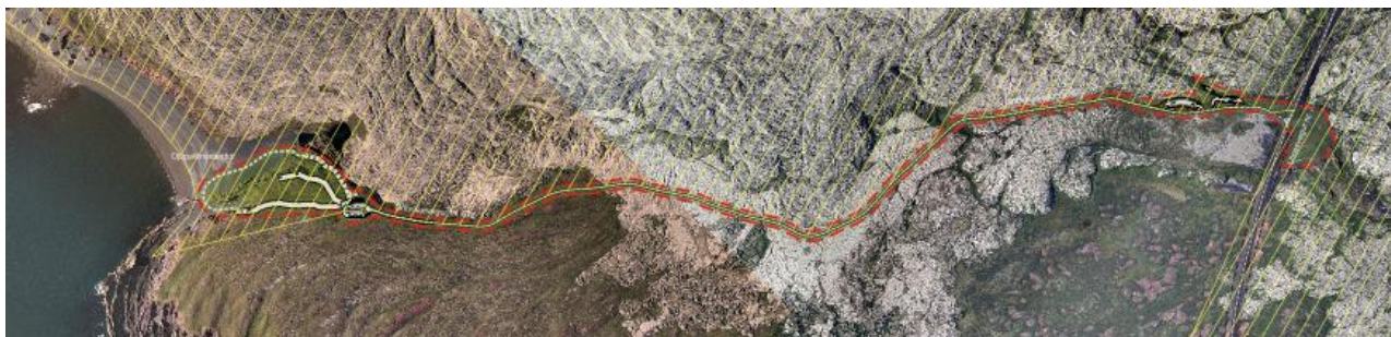
Mynd 1. Áætluð afmörkun deiliskipulagssvæðisins, rauð lína.

Deiliskipulagið nær yfir Dritvíkurveg og svæði meðfram honum, gatnamót Dritvíkurveg og Útnesveg og svæði þar við ásamt gömlu námunni austan við Útnesveg fyrir nýjan áningarstað ásamt áningarsvæði og aðkomu að Djúpalónssand, allt í Þjóðgarði Snæfellsjökuls. Stærð skipulagssvæðisins er rúmum 9 ha.