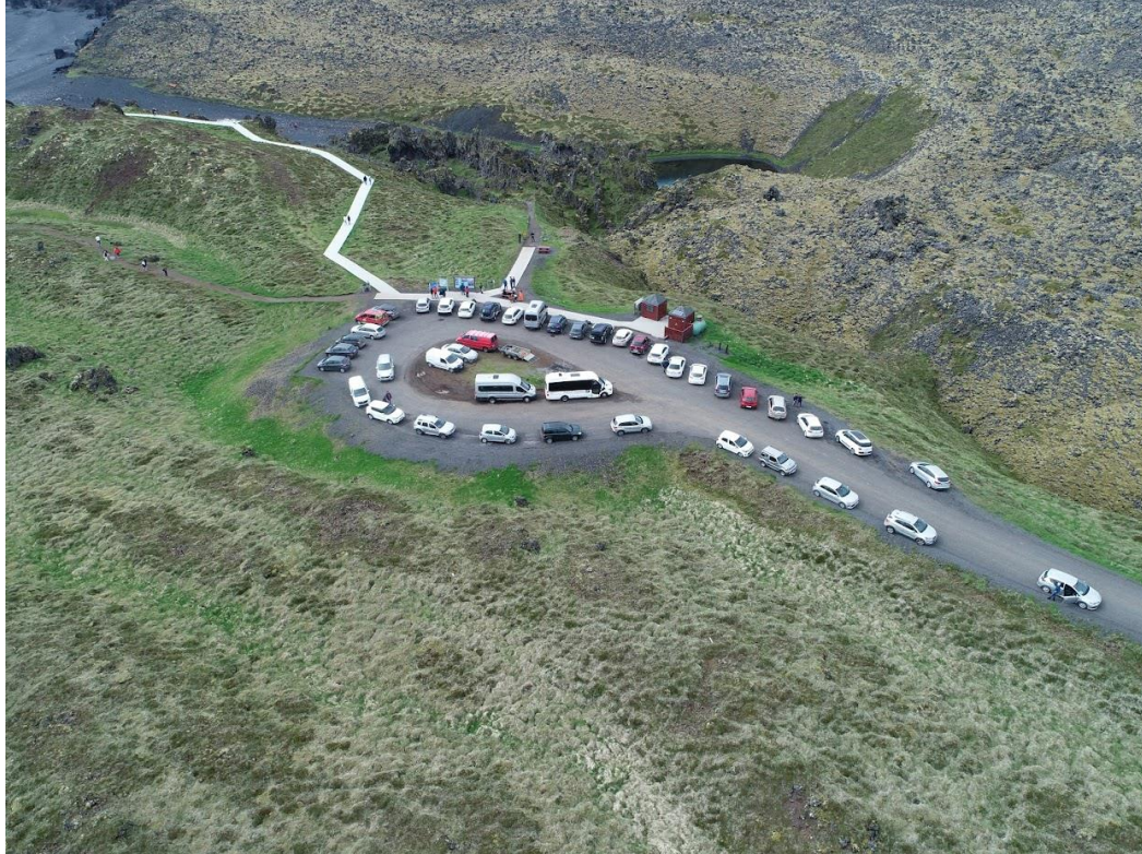
Mynd 2 Núverandi aðstæður við Djúpallónssand, stígur sem sker sig úr umhverfinu og yfirfull bílastæði.