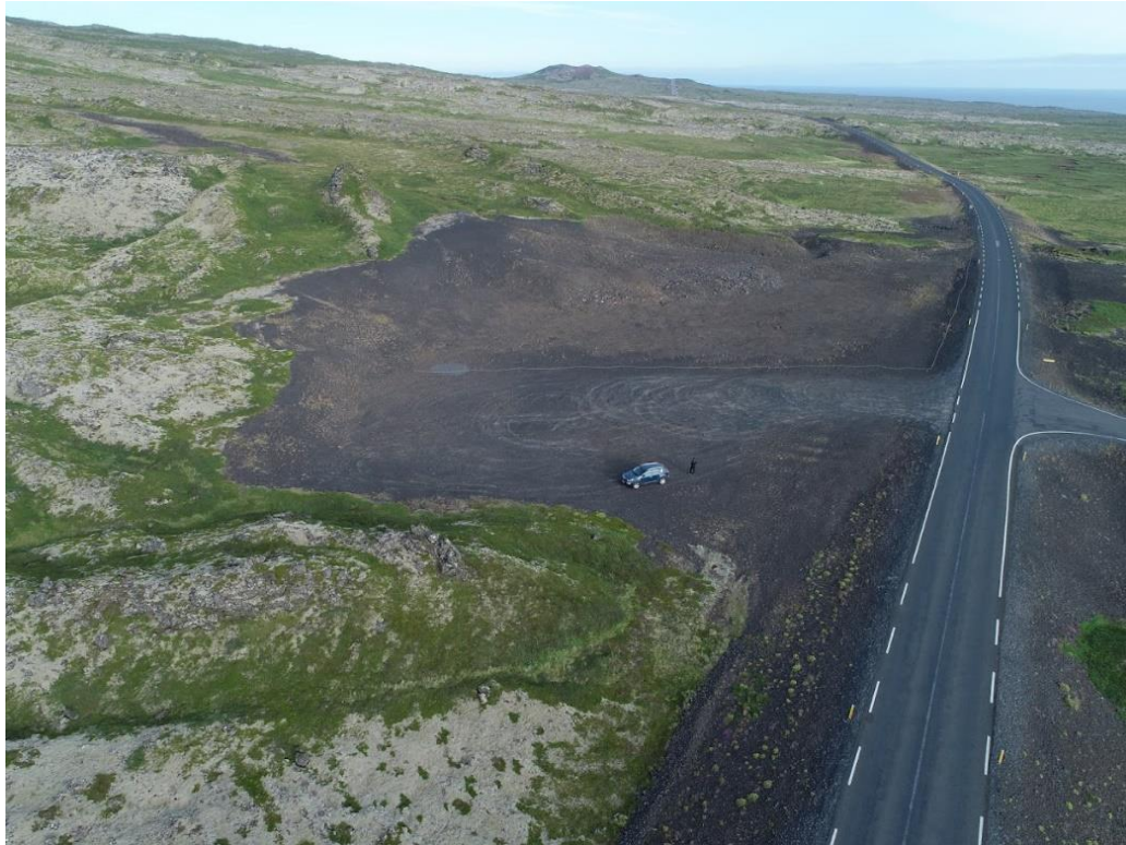
Mynd 4 Gamla náman austan við Útnesveg við gatnamót Dritvíkurvegjar.