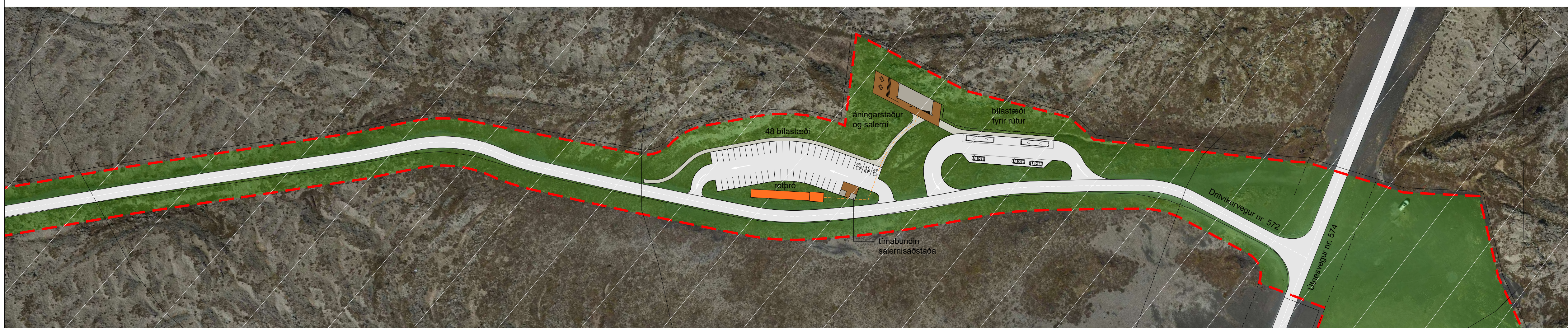
Deiliskipulag - Þjónustusvæði við Dritvíkurveg 1:1000

Deiliskipulag þetta sem hefur fengið meðferð skv. 41.grein skipulagslaga nr.123/2010 var samþykkt í skipulagsnefnd Garðabæjar þann _____ og í bæjarstjórn Garðabæjar þann _____