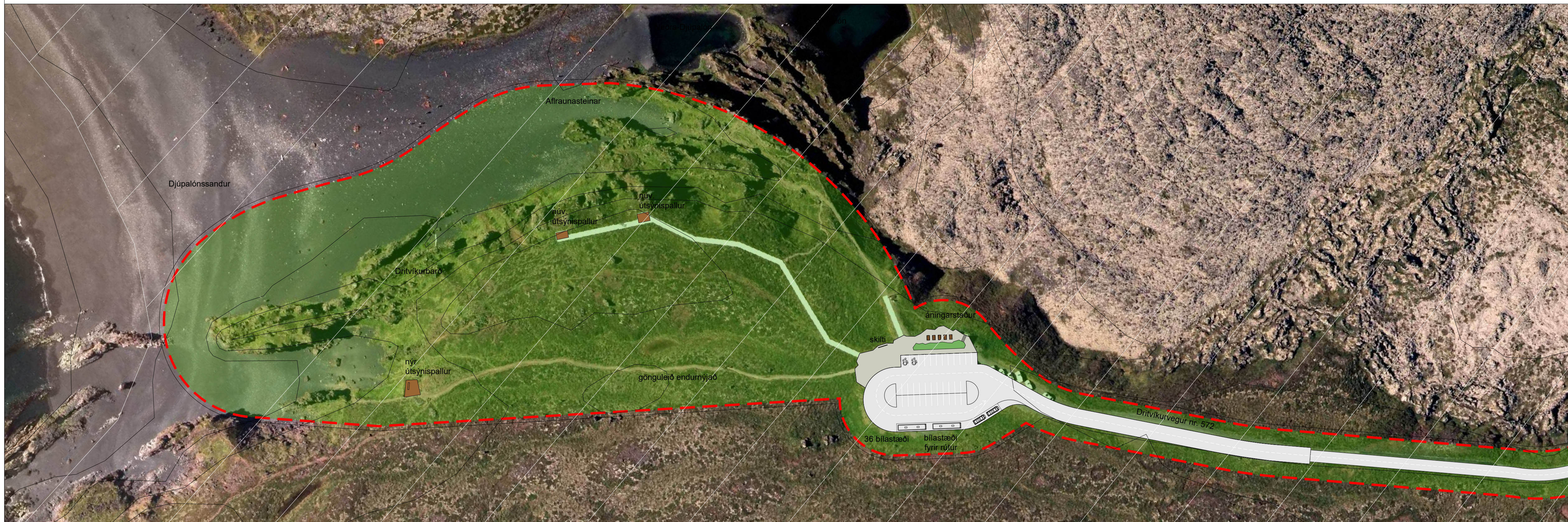
Deiliskipulag - Djúpalónssandur 1:1000