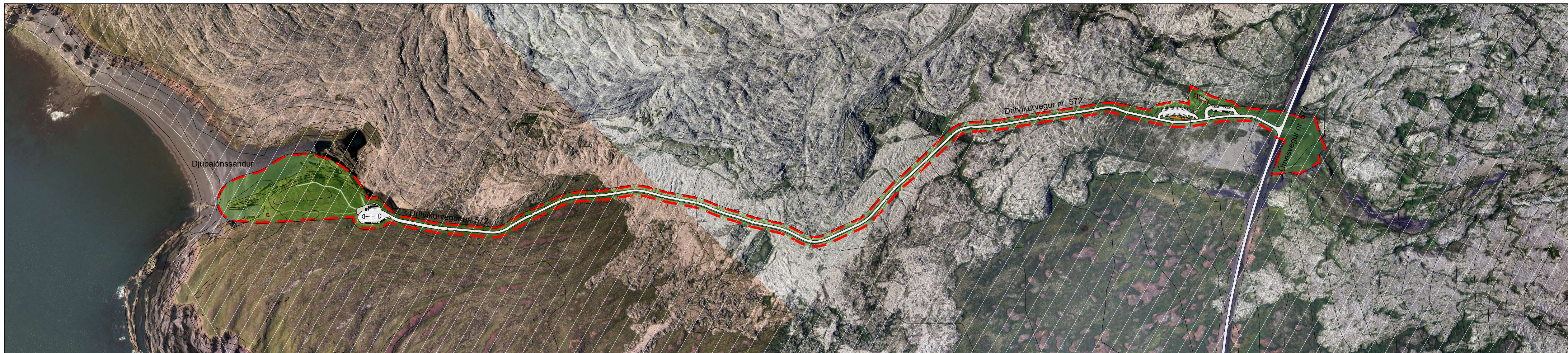
Deiliskipulags - Dritvíkurvegur 1:5000