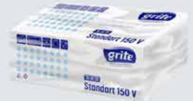
Miðapurrkur (Z- & V- brot) og rúllur.