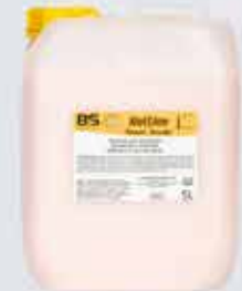
Hotline 8 húð og hársápa með mildum kókósilum.