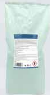
Taupvottaduft Voot 15kg.