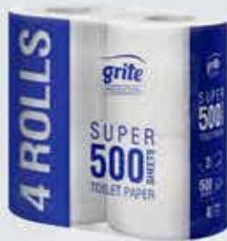
Salernispappír 500 blaða.