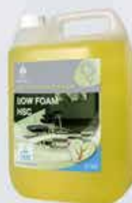
Gólfhápa ECO Selden Umhverfisvæn, lágfeyðandi hápa.