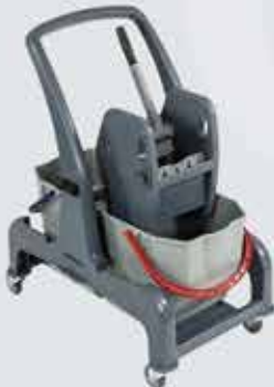
Ræstivagn CombiX Léttur ræstivagn með 2 x 25 L fötum.