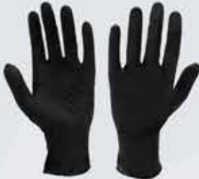
Einnota nitril hanskar sem henta vel við framleiðslu í eldhúsi eða við þrif.