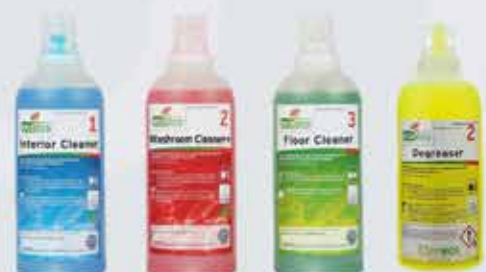
Ecodos umhverfisvottuð hreinsiefni í skömmtunarbrúsum.