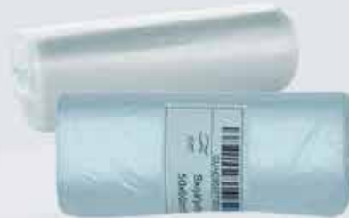
Skrjáfpokar í ýmsum stærðum. BIO maispokar fyrir lifrænan úrgang.