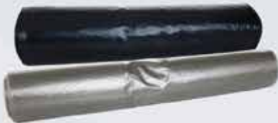
Sorppokar úr endurunnu plasti.