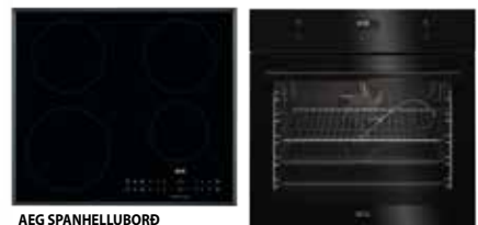
AEG SPANHELLUBORÐ IKB64301FB