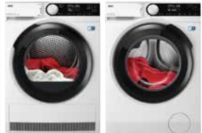
AEG ÞURRKARI TR934N85C 8KG M.VARMADÆLU