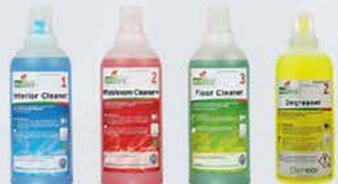
Ecodos umhverfisvottuð hreinsiefni i skömmtunarbrúsum.