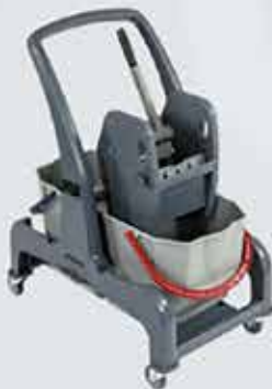
Ræstivagn CombiX Léttur ræstivagn með 2 x 25 L fötum.