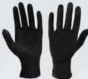
Einnota nitril hanskar sem henta vel við framleiðslu i eldhúsi eða við þrif.