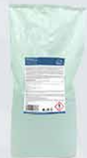
Taupvottaduft Voot 15kg.