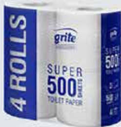
Salernispappir 500 blaða.