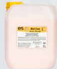
Hotline 8 húð og hársápa með mildum kókósilim.