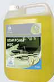
Gólfþápa ECO Selden Umhverfisvæn, lágfreyðandi þápa.