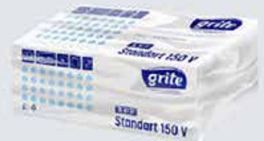
Miðapurkur (Z- & V- brot) og rúllur.