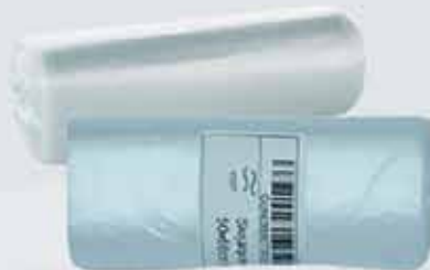
Skrjáfokar í ýmsum stærðum. BIO maispokar fyrir lifrænan úrgang.