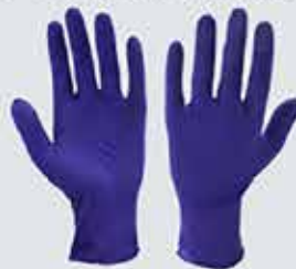
Einnota vinyl-stretch-hanskar á góðu verði úr blöndu af nitril og vínýl. Henta vel i t.d eldhús og þrif.