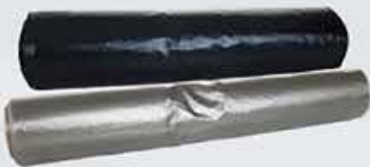
Sorpokar úr endurunnu plasti.