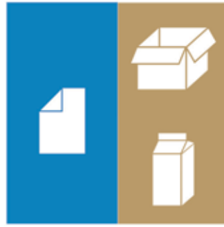
Pappi og pappír