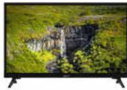
Digihome 12/230V ferðasjónvarp 24" Snjalltæki Verð: 54.900,- Tilboð 44.900,-