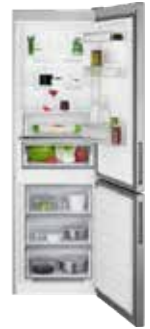
AEG kælikápur 186cm 220L / 93L Verð: 149.900,- Tilboð 112.490,-