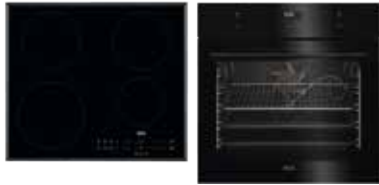
AEG ofn og helluborð Verð saman: 239.990,- Tilboð saman: 169.990,-