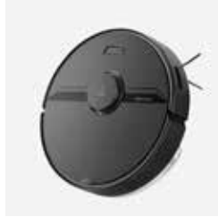
Roborock Q7 Verð: 74.900,-