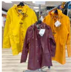
bykkir og fódraðir regnjakkar Verð: 21.990,- Tilboð 4.990,-