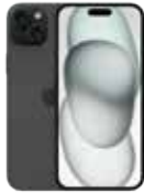
iPhone 15 sími Verð: 144.900,-