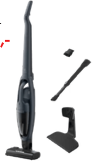
AEG QX7 Skafttryksuga Verð: 54.900,- Tilboð 44.900,-