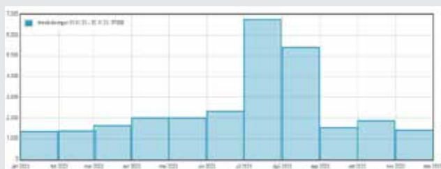
Innskráningar árið 2023