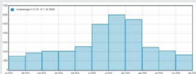
Innskráningar árið 2024