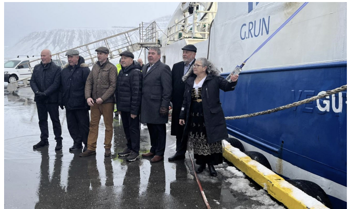
Skipinu var gefið nafnið Guðmundur SH 235, myndina tók Gunnar Kristjánsson.