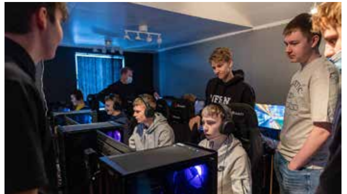
Fjölbrautaskóli Snæfellinga var fyrsti framhaldsskólinn til að bjóða upp á Raffþróta áfanga.

Florealis er íslenskt lyfjafyrirtæki sem býður upp á úrval skráðra jurta-lyfja og lækningavara sem byggja á